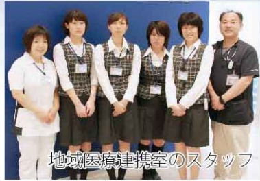
地域医療連携室のスタッフ

他の医療機関の先生とは、検査結果などの診療情報を密にやりとりしていますので、皆さんご安心ください。患者さんが不安なく病院・診療所を行き来できるような対応と、スムーズな橋渡しを心がけています。