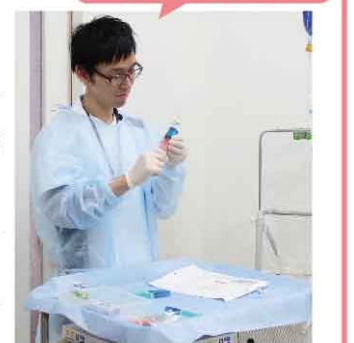
看護師が手術準備を担当

手術が終了したら、ベッドに横になったまま病室に戻ります。患者さんご本人はまだ鎮静剤でうとうととしていますから、ご家族に切除した病変を見ていただき、主治医が説明を行います。