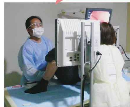
大腸内視鏡検査の様子