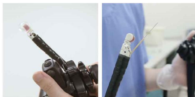
超音波内視鏡は、体の奥にある病変を超音波を使って観察したり（写真左）、組織を採取したり（写真右）することができる