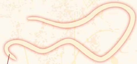
回虫目アニサキス科アニサキス属 (学名: Anisakis)

中でも加熱することが最も効果的と言われています。60℃で1分、70℃では瞬間的に死滅します。冷凍はマイナス20℃で24時間以上凍結すると死滅しますが、家庭用の冷蔵庫では死滅しないので注意が必要です。また、ワサビや酢ではアニサキスは死滅しないので、シメサバも注意してください。