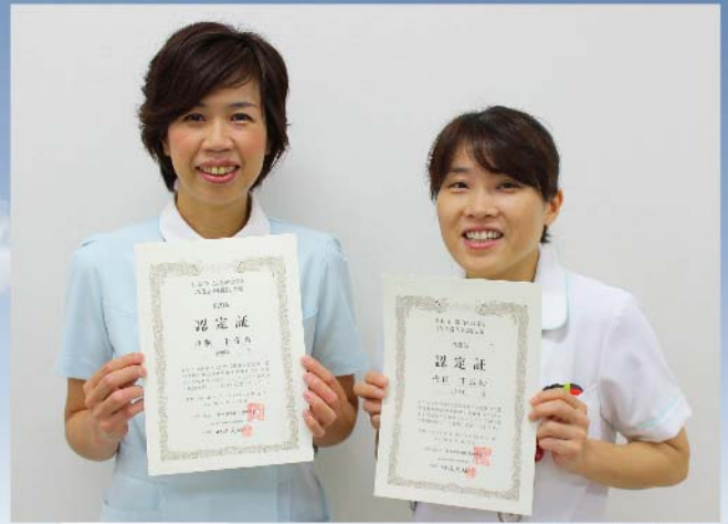
今回合格した内視鏡技師

今年度、新たに2名が試験に合格し、消化器内視鏡技師に認定されました。これにより、当センターの消化器内視鏡技師は、計5名となりました。