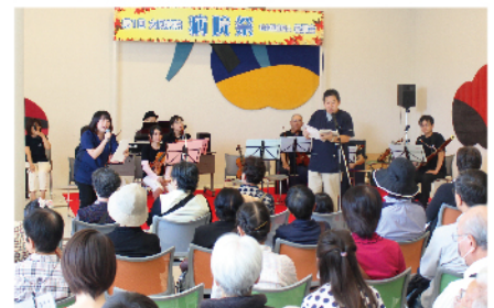
昨年の病院祭の様子