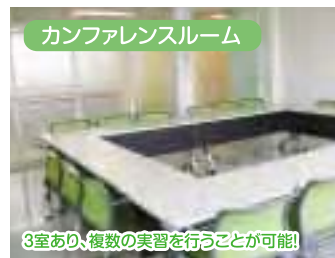
3室あり、複数の実習を行うことが可能!

このたび、大同病院保健センター棟2階の「旧環境衛生科」を改築し、「研修支援センター」を新設しました。この研修支援センターは、直接患者様に関わるものではありませんが、当院で実習をする看護学生やその他の実習生の環境改善と、当院職員の現任教育の充実を目的として設置しました。ここには、カンファレンスルーム・ロッカールーム(4室)・ラウンジ等が整備されており、多くの実習生を受け入れる態勢を整えています。このセンターを利用して、臨床講義・カンファレンス・研究活動等を実施することで、質の高い医療職が育つよう、宏潤会全体で支援します。