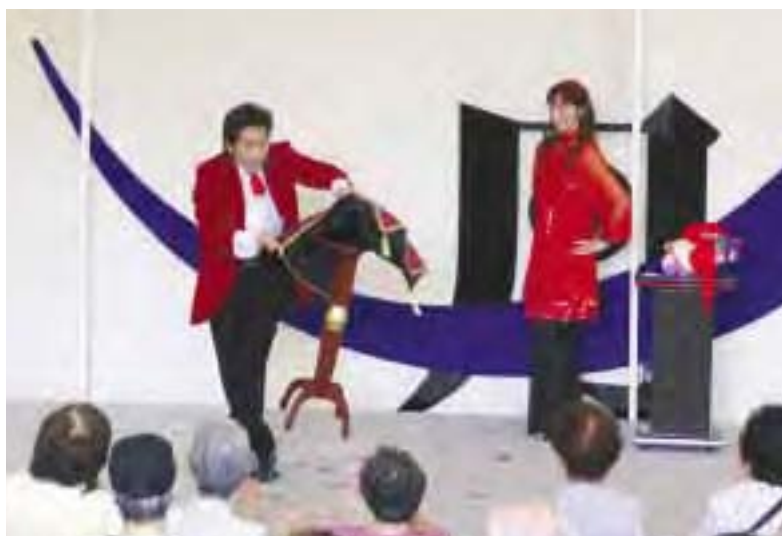
7月7日 だいでうクリニック 1階ホールで開催「Magic Show」