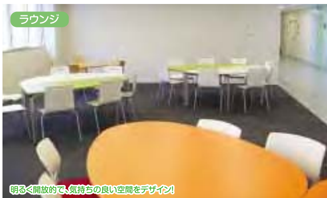
明るく開放的で、気持ちの良い空間をデザイン!

このたび、大同病院保健センター棟2階の「旧環境衛生科」を改築し、「研修支援センター」を新設しました。この研修支援センターは、直接患者様に関わるものではありませんが、当院で実習をする看護学生やその他の実習生の環境改善と、当院職員の現任教育の充実を目的として設置しました。ここには、カンファレンスルーム・ロッカールーム(4室)・ラウンジ等が整備されており、多くの実習生を受け入れる態勢を整えています。このセンターを利用して、臨床講義・カンファレンス・研究活動等を実施することで、質の高い医療職が育つよう、宏潤会全体で支援します。