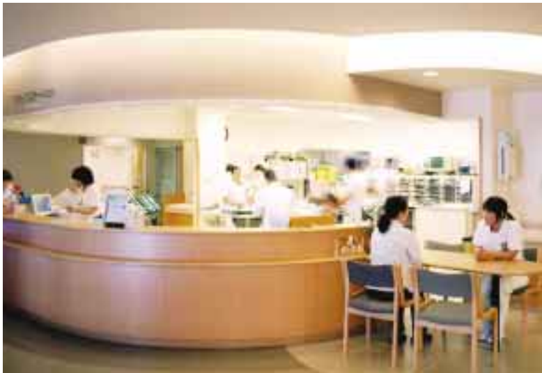
大同病院 スタッフステーション